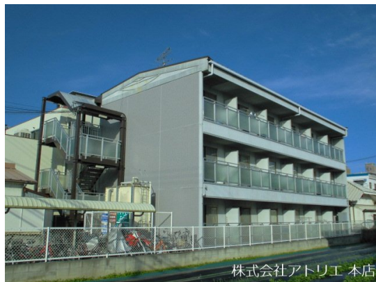
株式会社アトリエ 本店