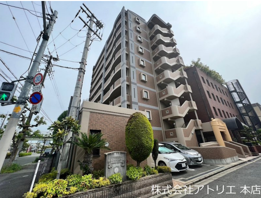
株式会社アトリエ 本店