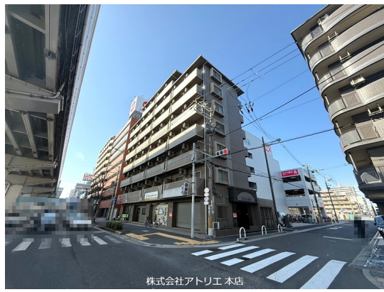
株式会社アトリエ 本店