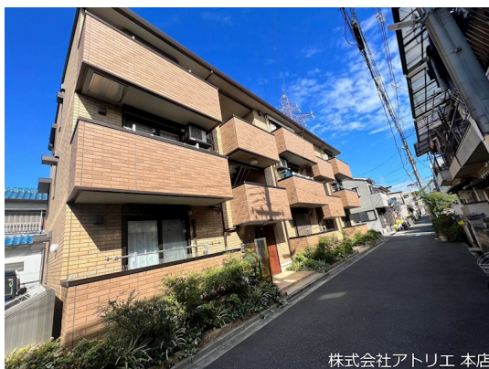
株式会社アトリエ 本店