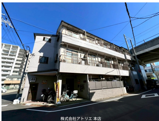
株式会社アトリエ 本店