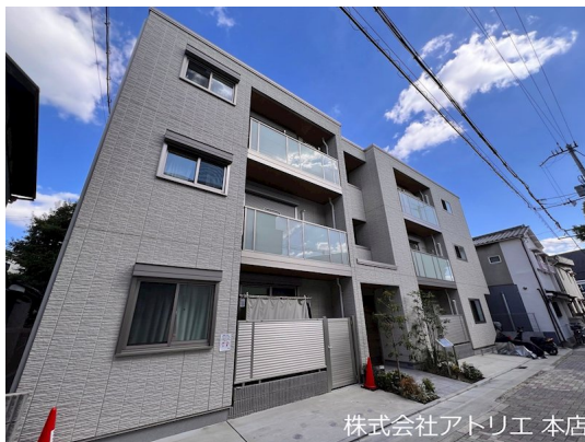
株式会社アトリエ 本店