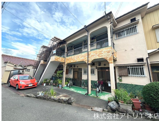
株式会社アトリエ本店