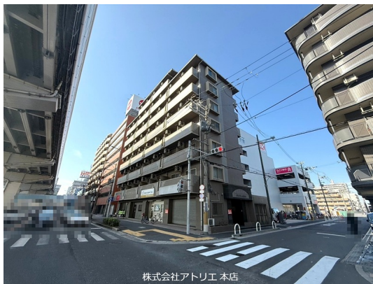
株式会社アトリエ 本店